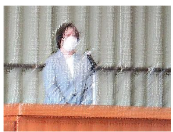
【4月8日の着任披露式・始業式の様子】