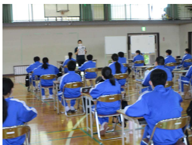
◇体育館での社会の授業◇