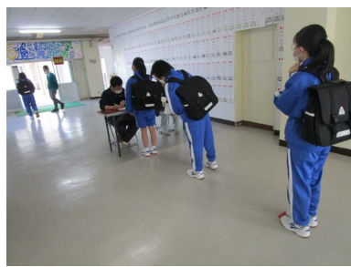
◇朝の検温・健康チェック◇