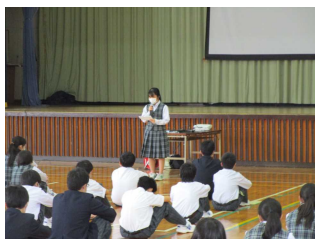
◇新入生を迎える会◇