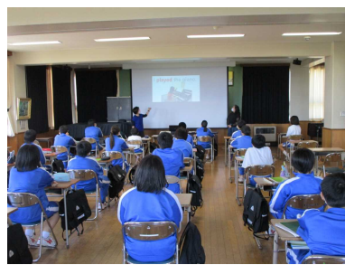
◇多目的室での英語の授業◇