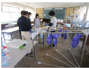
◇シルバー人材センターの皆さんと教職員による消毒作業◇