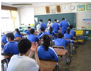
◇班ごとの給食の受取・配膳が一品のみの献立◇