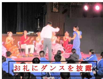
お礼にダンスを披露

スペイン舞踊を見て、フラメンコの多様さ、衣装の多さなどを知りました。ワークショップで学んでいなかったことを含め、たくさんのことを学びました。また、代表生徒が舞踊団の皆さんとフラメンコを踊っているのを見て、「身近な人がダンサーのような衣装を着てダンサーのように踊ってる! カッコいい!」と感じました。めったに見ることができないフラメンコを見させていただきとてもうれしかったです。またこのような機会があれば自分からダンスに参加したいと思いました。ぜひ来てください。