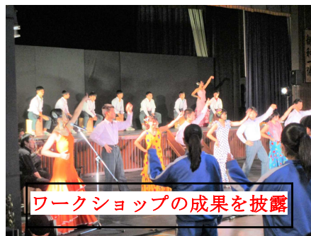
ワークショップの成果を披露

初めてのスペイン舞踊は迫力がすごくあって、一つ一つの音楽が変わるとのきれいな衣装や少しずつ違う音を出すフラメンコの「歌」での体の表現は、指先まで見てみるととても美しかったです。また、舞踏家の皆さんの一人一人の顔の表情が笑顔になったり、少し暗くなったりと見ている私まで感情が入り、引きよせられるようです。これからも様々な舞台で今日のようなスペイン舞踊をいろんな人達に見せていってほしいと思います。