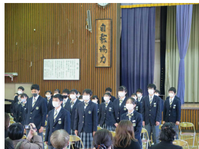
学年全体で「誓いの言葉」を発表