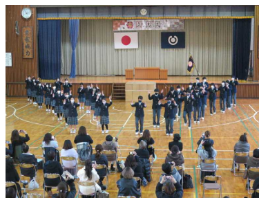
クラスごとにダンスを披露