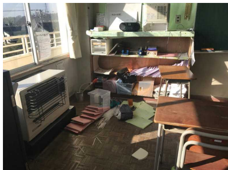
地震翌日の教室の様子