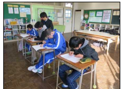
青雲・潮風学級でも授業体験が行われました。