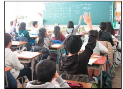
初めての「数学」にも関わらず楽しそうに学習しました。

また、今回の体験授業に先立って各小学校には部活動の説明をした掲示物を作成し、掲示していただきました。友達と興味深そうに二中の部活動の写真を見ていました。