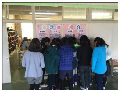
掲示した部活動紹介を熱心に見る6年生たち