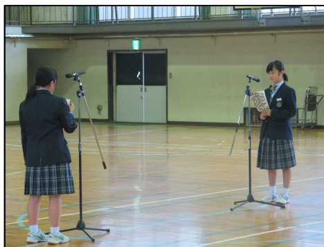
各学級からの質問に丁寧に回答しました