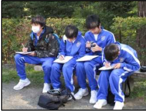
塩竈神社でスケッチ

10月26日(木)自分たちが生活している地域を見直し、塩竈の良さを再発見するために1年生がウォークラリー形式で地域学習を行いました。当日は天候にも恵まれ、グループに分かれてあらかじめ設定したポイントを経由しながら塩竈神社のゴールを目指しました。活動をとおして今以上に塩竈が好きになったことと思います。