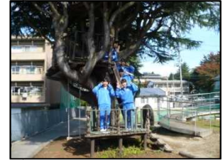
エспのツリーハウス